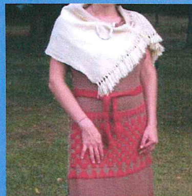
Vestito in lana tessuto a tela con inserimenti a broccato. Scialle in lana bordato a frange

DIMOSTRAZIONI TECNOLOGICHE, ESPOSIZIONE DI MATERIALI E MANUFATTI