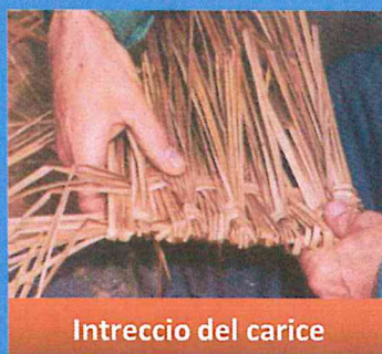
Intreccio del carice