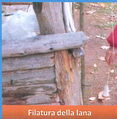
Filatura della lana

I REPERTI ARCHEOLOGICI RACCONTANO COME VENIVANO PRODOTTI ABITI, MONILI ED OGGETTI NELLA PREISTORIA. ESSI MOSTRANO CHE L'UOMO, GIÀ IN PASSATO, AVEVA ELABORATO UN SICURO SENSO ESTETICO, ANCHE PER ABBELLIRE LA PERSONA.